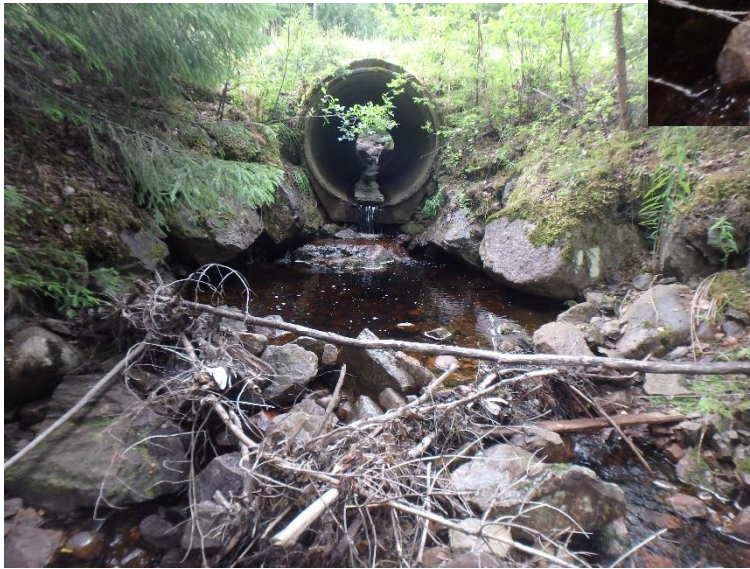
Trumma under RV 62