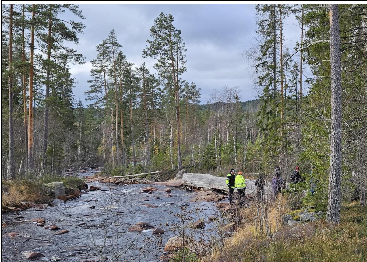
Vid styrsjärmen Kølans fall ner mot Halgån