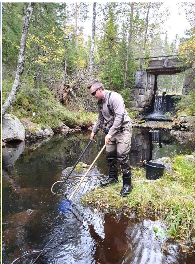
Projekt 5 Musåsystemet – Elfiske 11 lokaler