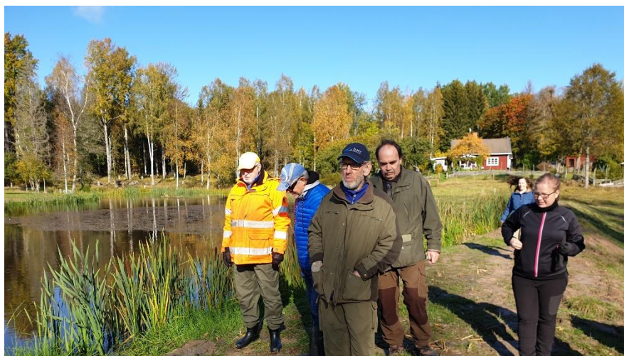
Foto 5 Vattendragsvandringen i Tjärnsystemet tog lunch vid den nyanlagda dammen vid Älvsbacka – som reducerar näring från skog och hem och bidrar till biologisk mångfald.