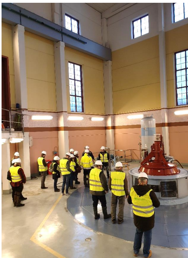
Foto 1 Fortum guidar runt på anrika Munkfors kraftverk

Två studiebesök har skett: I februari besökte vi Munkfors kraftverk och i november fick vi en intressant guidning vid den nya, högteknologiska, fiskodlingen vid Gammelkroppa.