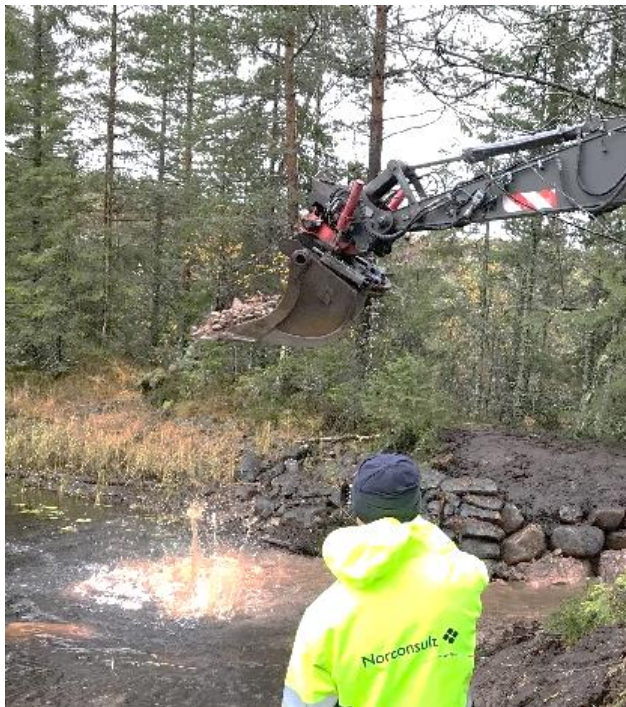
Projekt 3: Klamma älv: Damnutrivning Lankan