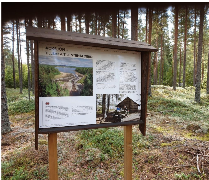
Foto 4 Acksjön - tillbaka till stenåldern - står det på skylten som förklarar dammutrivningen

Vi har satt upp en skylt ute vid båthuset som förklarar varför stränderna är så kala och berättar om syftet med dammutrivningen.