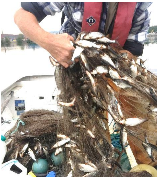
Projekt 2 Värmullen. Provfiske aug 2019

Klarälvens vattenråd har under året arbetat med praktiska åtgärder i främst fyra projekt: