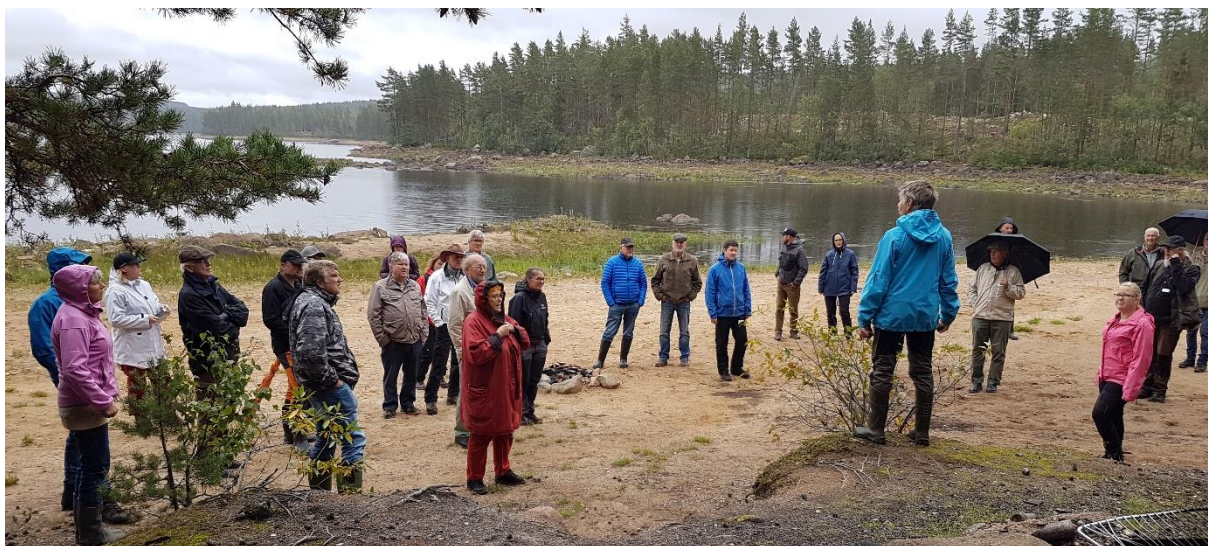
Foto 3 Vattenrådets dag vid Acksjön blev en start för mer aktivt samarbete mellan Värmlands vattenråd

Uppfyllelse: Vi har nu mycket god samverkan mellan vattenhandläggarna i fyra kommuner. Vi har under 2019 utvecklat detta samarbete. Vi har länge haft en aktiv samverkan med Hagfors och Forshaga kommuner som nu utvecklats även till Torsby och Karlstads kommun. Tyvärr har Hammarö kommun sparat bort tjänsten som hade ansvar för Klarälven. Under 2018–2019 har strävan att få till en gemensam tjänst legat nere på grund av det dåliga gensvar vi fick 2017. Diskussioner på Vattenrådets dag vid Acksjön i sept 2019 fick till följd att samordnarna i Värmlands vattenråd framgent ska ha regelbundna möten för att dryfta gemensamma problem. Länsstyrelsen är sammankallande.