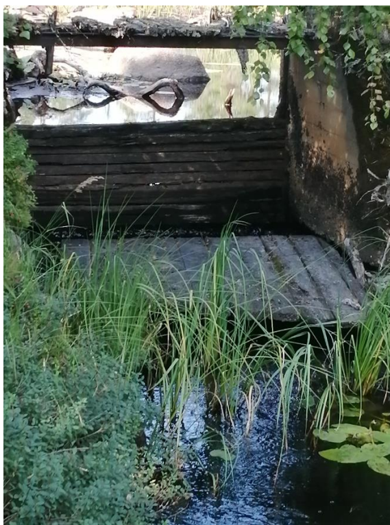
Projekt 5 Fämtansystemet – Inventering (foto damm vid Gresjön) och elfiske