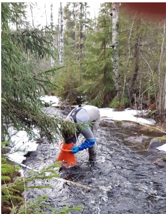
Projekt 3: Klamma älv: Romutsättning