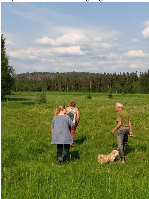
Projekt 4 Blysjön: Samråd med markägare om tillskapande av våtmark (foto fr 2019)