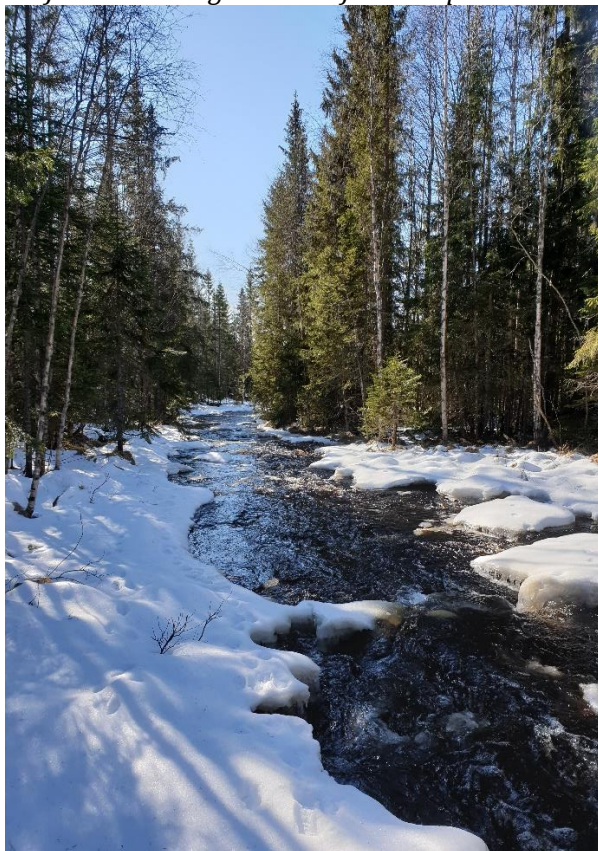
Proj 5 Inventering Musån inför biotopvård