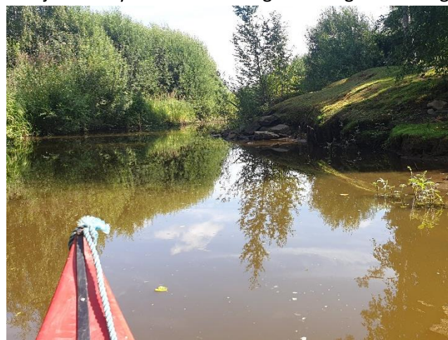
Projekt 12 Hyn – undersökning av näringsbelastningen