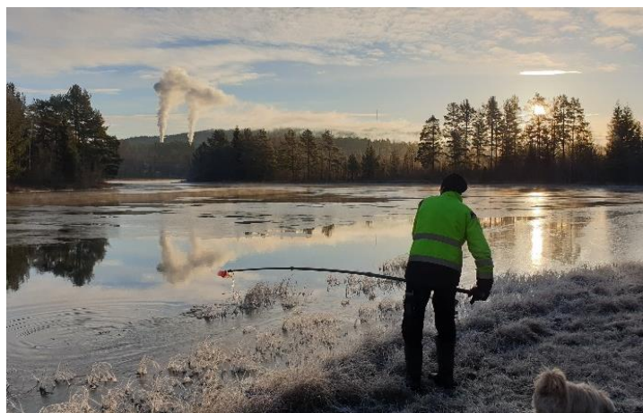
Projekt 2 Värmullen. Undersökning av vattenkvalitet