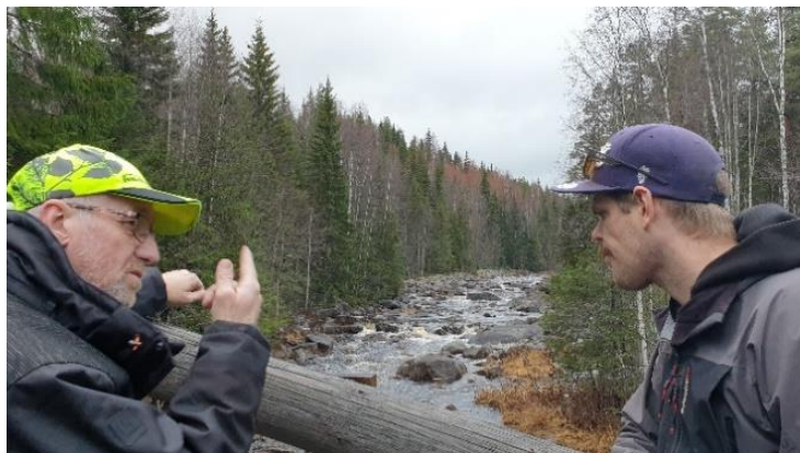
Projekt 13 Undersökning av Tåsan och framtagande av en Lokal Åtgärdsplan för Havån