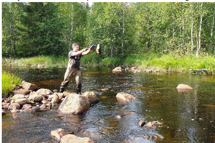
Projekt 6 Musån Biotopåterställande efter flottning