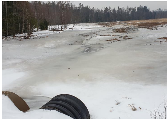
Projekt 4 Blysjön – åtgärder för reduktion av näring